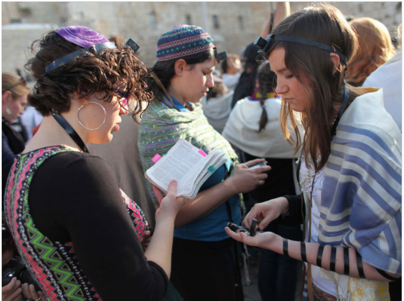
"משמעות המתווה היא היפרדות מוחלטת". נשות הכותל

גורם חרדי בכיר אמר כי מדובר דווקא בניצחון לחרדים לאחר מאבק ארוך השנים, שהתפרס על כשני עשורים. "אין ספק שזה ניצחון לחרדים. גל הטרור והמתרחקות סביב הר הבית בחודשים האחרונים הובילו לכך שנשות הכותל ושאר הארגונים הרפורמיים והקונסרבטיביים הבינו שאין ברירה אלא לקבל את המתווה הקיים, כי שינויים מהותיים אחרים עלולים להתסיס את האווירה במזרח התיכון".