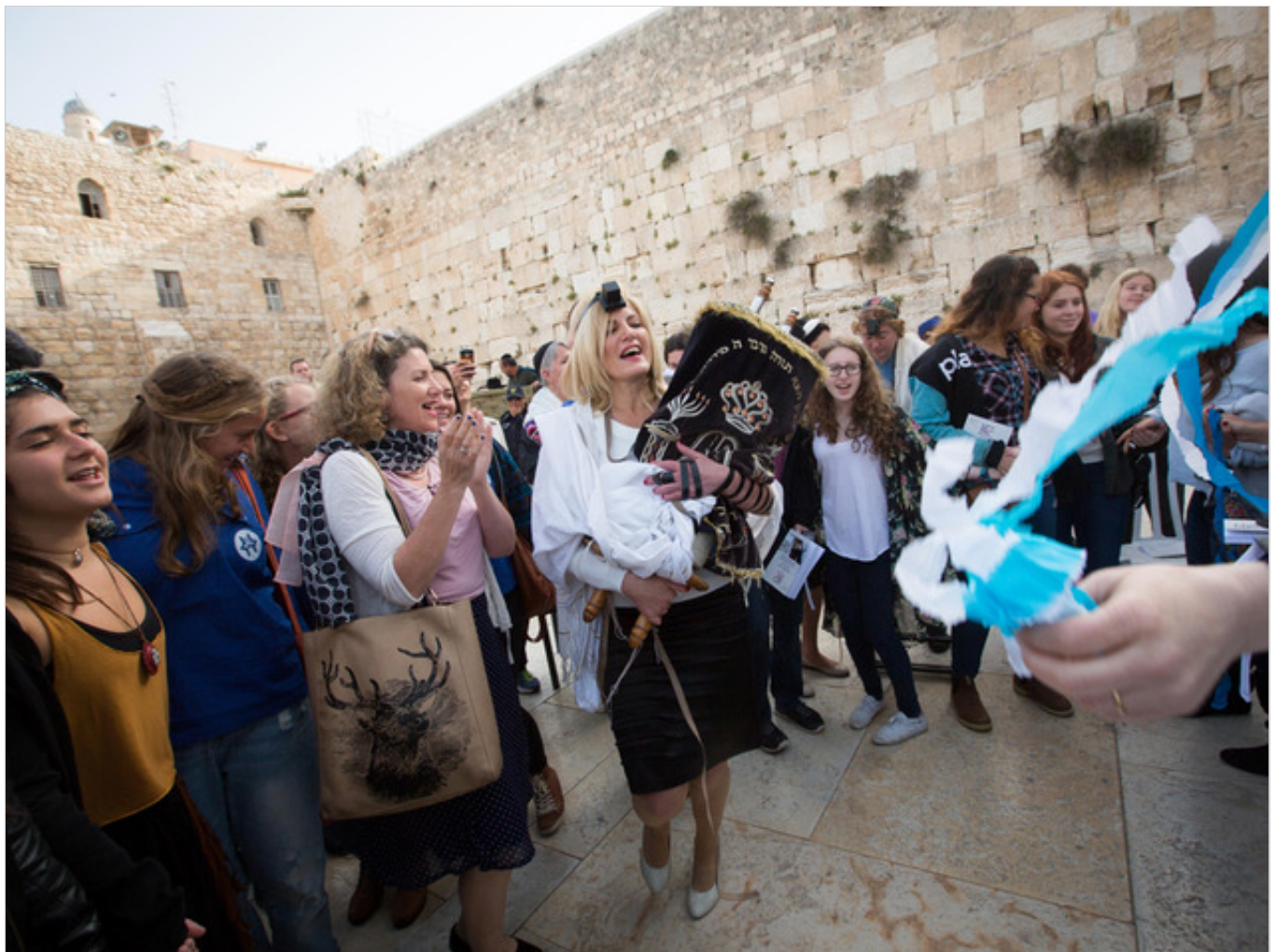
נשות הכותל הכניסו ספר תורה לעזרת הנשים, אפריל האחרון

כמו כן עולה מהמסמך כי הממשלה תקצה סכום של 35 מיליון שקלים לצורך הכשרת רחבת התפילה החדשה, אך טרם ברור מקורו. בנוסף לכך, תקציב הניהול השוטף של רחבת התפילה, לרבות רכש חד פעמי, יתואם עם משרד האוצר במסגרת דיוני התקציב לשנת 2017. ככל שיהיה צורך בתקצוב כבר השנה, משרד האוצר יעמיד את הסכום הנדרש לרשות משרד ראש הממשלה.